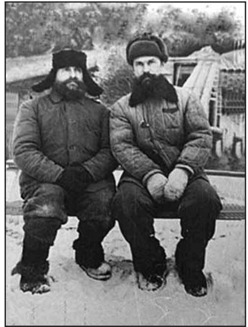
У засланні, Ангарськ, 1952 р.

Як написано в його некролозі: «Найяскравішою рисою характеру Н.П. Храпова була його безкомпромісність, любов до правди і євангельської чистоти. Він був чолові-