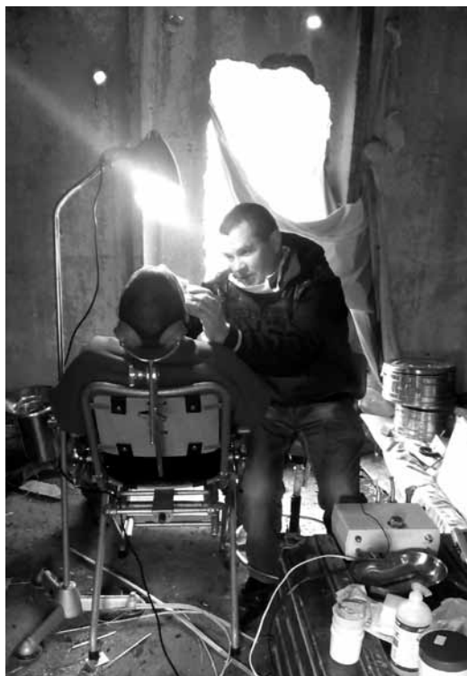
Працювати доводилося у справжніх польових умовах: у приміщеннях з вибитими стінами.

Основним нашим завданням було надати медичну допомогу населенню. Спочатку, правда, я був переконаний, що мирне життя вже нормалізувалося і ліки їм не потрібні. Але насправді в аптеках їх не вистачає. Діагностика й лікування, звичайно, не відрізняється від тих, що в Карпівці. Читали кардіограму, флюорографію й УЗД, робили аналізи, показували вправи для фізичної реабілітації. Хірург розтинав абсцеси в колишніх наркоманів, а вертебролог допомагав тим, у кого боліла спина. Багато психосоматичних захворювань (прояв стресу) посилювали напруження під час прийому. Психологи та душеопікуни допомагали розрядити ситуацію, дати пораду.