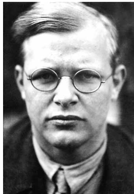
Врач концлагеря Флоссенбург вспоминал:

Даже если в этом мире не будет места христианству, даже если христиане окажутся в положении гони-