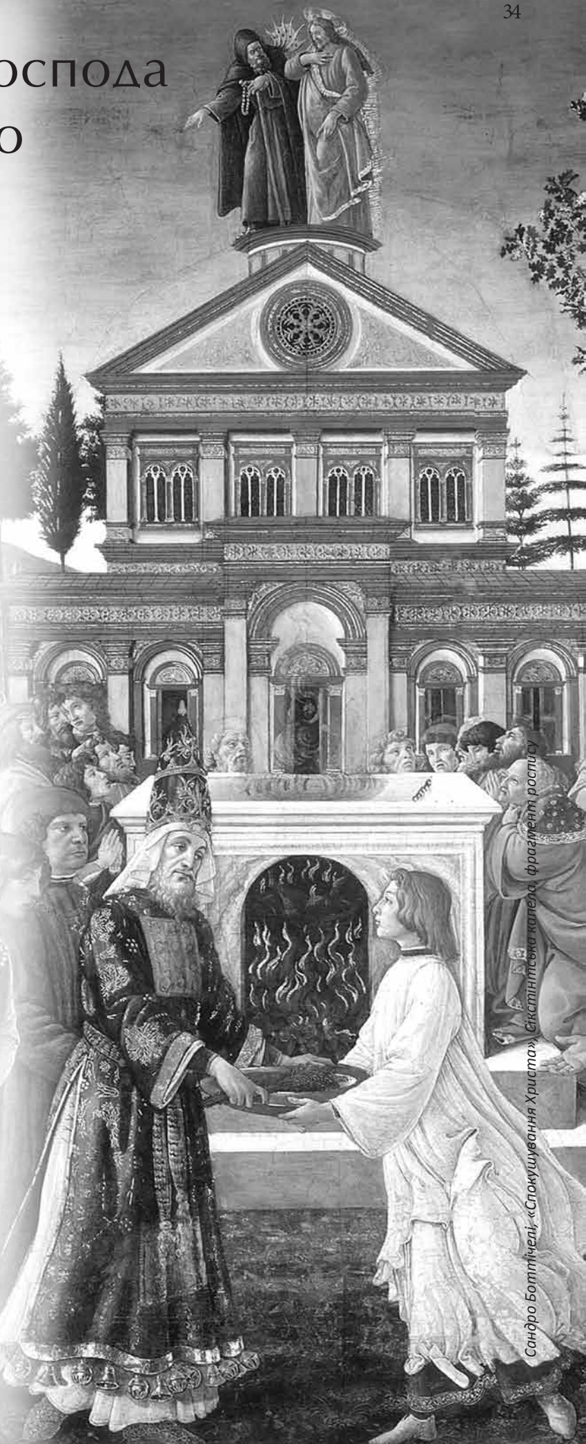
Сандро Боттічеллі. «Спокушування Христа». Сікстинська капела, фрагмент розпису