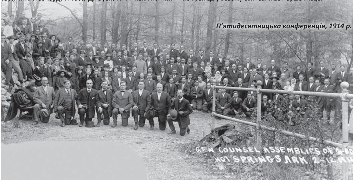
П'ятидесятницька конференція, 1914 р.

На тепер Всесвітнє Братство Асамблеї Бога є однією з найбільш швидкозростаючих християнських деномінацій у світі: з 1988 по 2010 рік число віруючих збільшилося з 18 до 64 млн. За кількістю віруючих є третьою (після Римсько-католицької та Російської православної церкви) християнською деномінацією у світі. За кількістю громад у всьому світі займає перше місце.