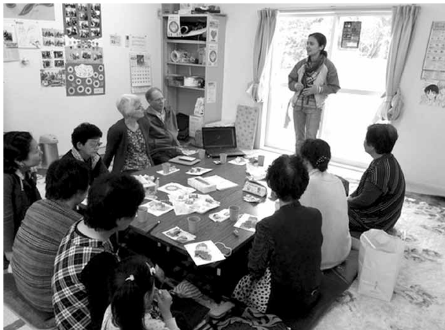
Місто Тохоку, яке постраждало від цунамі 2011 року. Зустріч з жителями тимчасового поселення

Японці — дуже делікатна нація. Там не проходять такі методи євангелізації, як в Україні. Наприклад, не можна просто так заговорити з людиною на вулиці. Вони не терп-