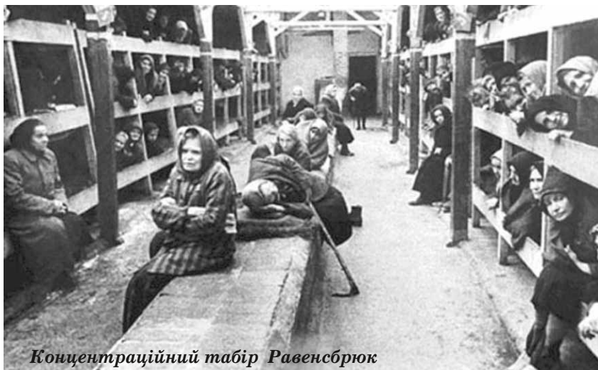
Концентраційний табір Равенсбрюк

«Міс тен Бум, я б дійсно хотів вам допомогти, але ви мусите все розповісти мені», — почав говорити з нею офіцер, надаючи своєму голосу довірливого тону. Коррі, як і інших членів підпілля навчили, як невимуснено і зацікавлено відповідати на запитання, але не видавати ніякої інформації. Коррі була