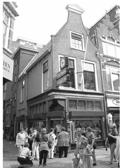
Музей Коррі тен Бум