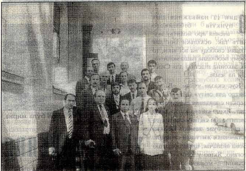
Випуск студентів ЗБі першого та другого наборів, 1995 рік.