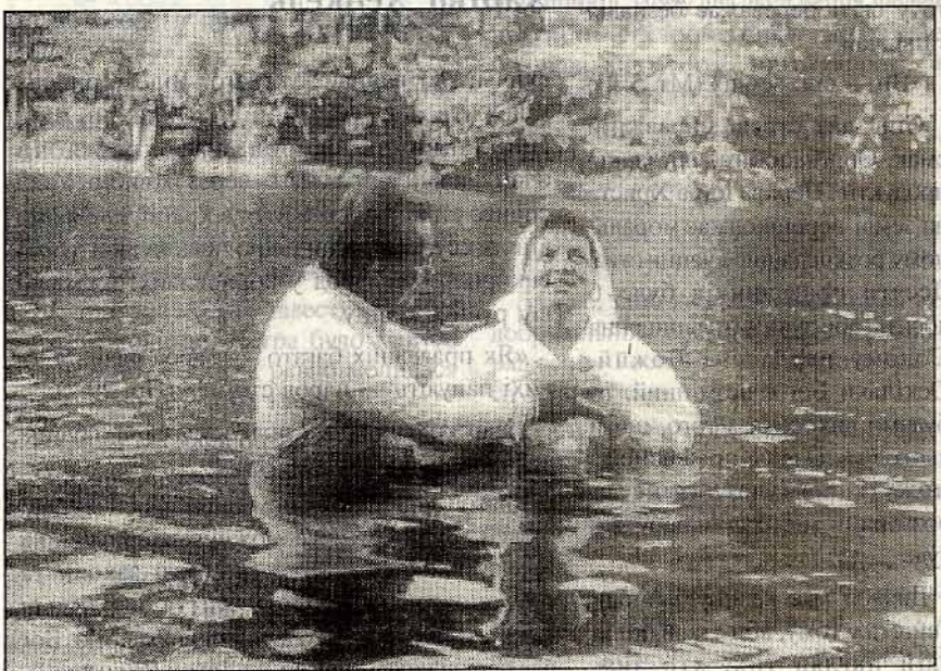
Водне хрещення, церква «Силоам», Київ.