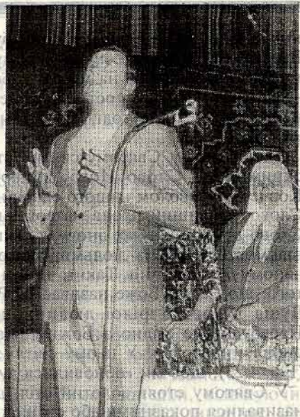
Молитва (Черкаси, Корнічук П.С.)