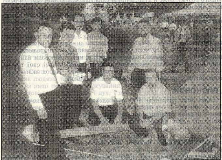
Організаційний комітет молодіжного фестивалю, що відбувся на Прикарпатті в с.Заріччя, 1995 р.