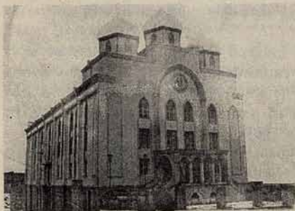
Новозбудований молитовний будинок церкви "Свята Трійця" у м.Рівне

35-45 — ваше життя не є на належному духовному рівні. Перегляньте свої стосунки з Богом, людьми, близькими. Моліться і просіть Божого благословіння на ваше життя, і щоб Бог вивів вас із того становища, у якому ви опинилися. Більше читайте Біблію, перебувайте у спілкуванні з віруючими.