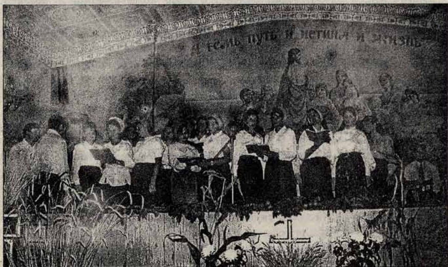
Свято жнив у Домі молитви м. Синельниково (Дніпропетровська обл.)