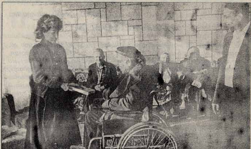
Працівники місії "Зірка Вифлеєму" у будинку престарілих (Закарпаття, м.Виноградів)