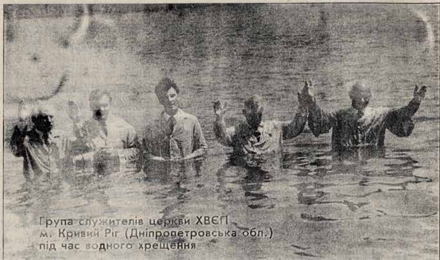
Група служителів церкви ХВЕП м. Кривий Ріг (Дніпропетровська обл.) під час водного хрещення