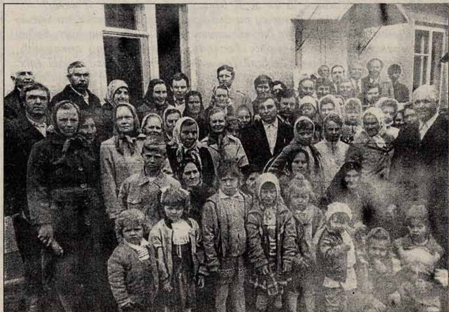
Громада церкви с.Оженино біля Дому молитви (Рівненська обл., Острожський р-н)