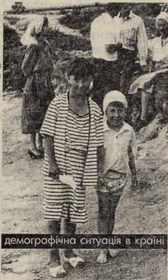
демографічна ситуація в країні

Повідомляє Національний інститут стратегічних досліджень Академії наук України